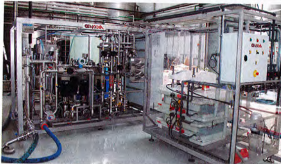
■ Figure 1: Système de recyclage d'eau de processus par osmose inverse.

Au-delà des avantages qualitatifs que peut apporter ce type de procédé en ligne sur la préparation des vins à la mise en bouteille, un des intérêts majeurs est la compacité de l'équipement. La place en cuverie est une problématique récurrente dans les caves. Coupler ces deux procédés permet un gain significatif en termes d'encombrement (surface nécessaire pour une unité de capacité 6000 L/h < 50 m²). Dans le cadre d'un projet de nouvelle cave, ce couplage permet d'optimiser l'investissement. Plus de cuves pour le traitement par le froid, pas de froid négatif (seul un réseau d'eau glacée est nécessaire pour la vinification et/ou la conservation).