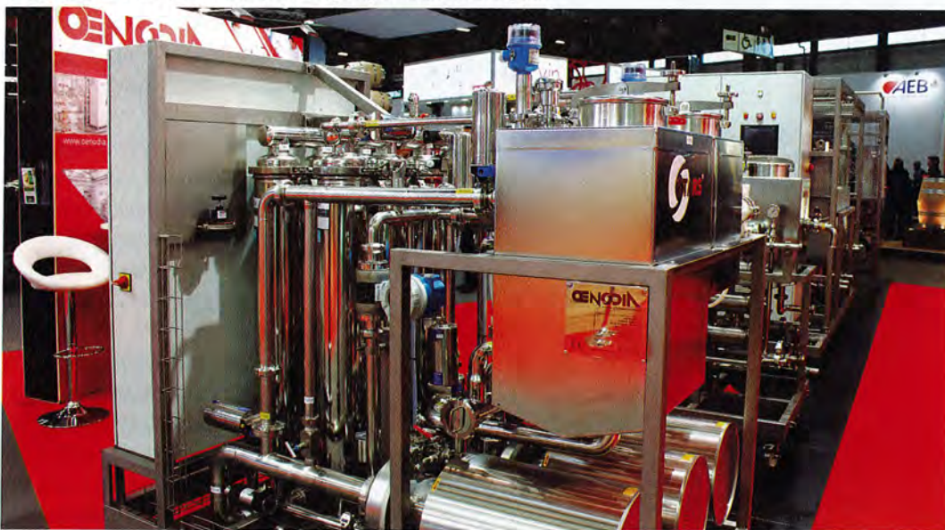
■ Photo 1 : Équipement du procédé de traitement en ligne, composé d'un filtre tangential et d'une unité de stabilisation tartrique par électrodialyse.

filtré et stabilisé). Tout transfert de vin entre la filtration et la stabilisation tartrique est éliminé. Les risques de dissolution de l'oxygène de l'air sont minimisés (< 0,2 mg/l entre l'entrée du vin brut et la sortie du vin filtré et stabilisé) et sans perte notable de CO 2 . Le nombre de sulfites est réduit, en raison de la réduction du nombre de transferts de vin.